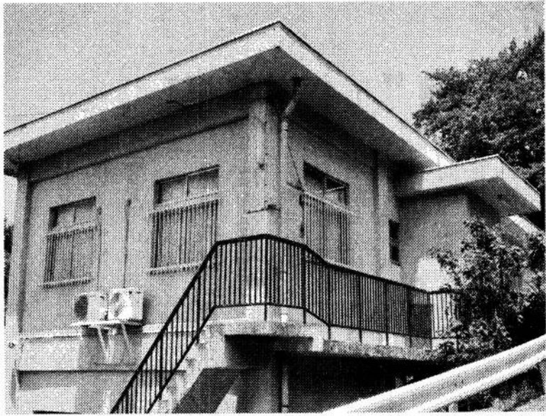
廃止になった嵐山町立吉田集会所

嵐山町立吉田集会所は、田集会所は、1974（昭和49）年に建設された施設で、廃止の理由は、耐震診断の結果「危険建物」と判定されたためです。